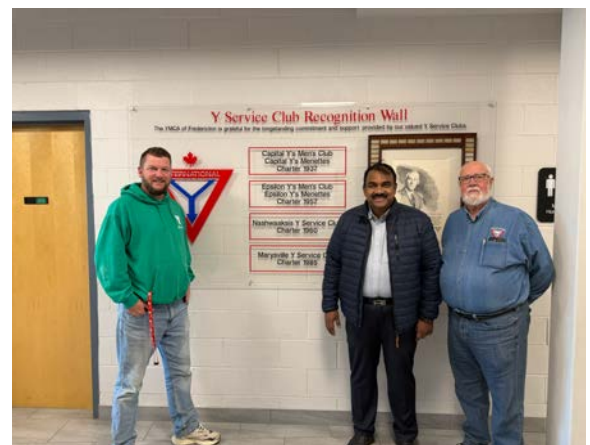
加拿大Fredericton基督教青年會的致敬，讚揚各社的貢獻

自成立以來，國際聯青社(YMI)一直致力於支持基督教青年會(YMCA)及其使命。作為回報，基督教青年會鼓勵國際聯青社及其全球各地社的成長與發展。雖然兩個組織各自獨立運作，但它們共享服務社區和改變全球生活的共同願景。基督教青年會與國際聯青社的組織架構和運營模式可能因國家而異，以反映當地現實和社區需求。然而，這些差異從未削弱兩個組織的共同目標。