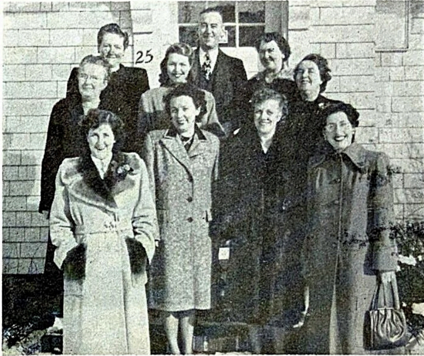
THE STAFF AT 25 QUINCY STREET

Personnel of the International Secretary-Treasurer's office pose for smiling portrait with their smiling boss.