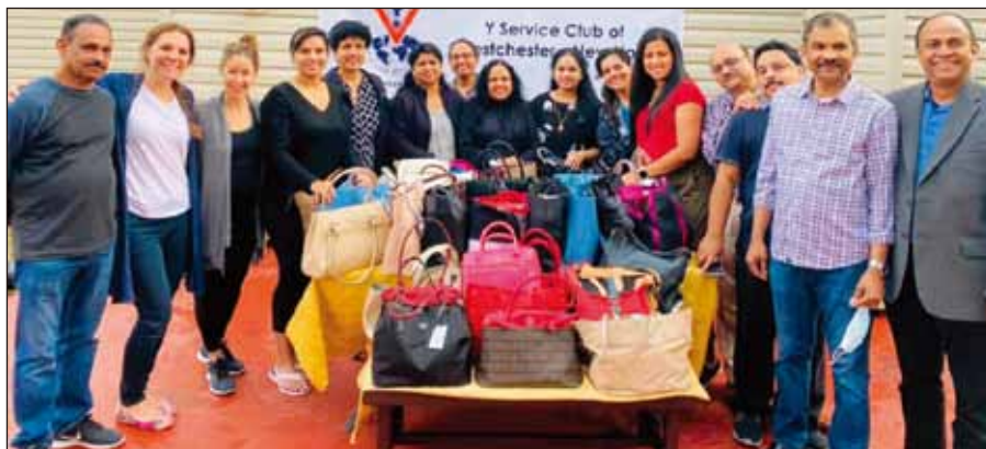
紐約威徹斯特聯青社社友、僑聯和他們所收集，將用來捐贈的手提包和錢包