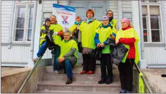
歐洲—愛沙尼亞：一小群Pärnu社社友走在Pärnu Raeküla區 Päts 家的一些小路上清潔該地區的街道、草坪和公車站作為 Week4Waste 項目的一部分