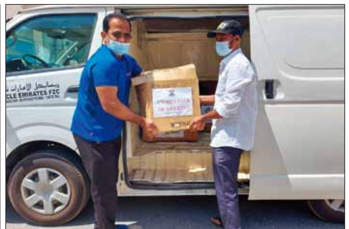
印度洲域—沙迦：沙迦社社友專注於收集電子垃圾，目的是要讓人們認知到不適當地處理它的危險。收集了幾箱電子產品，包括數位溫度計到電腦。