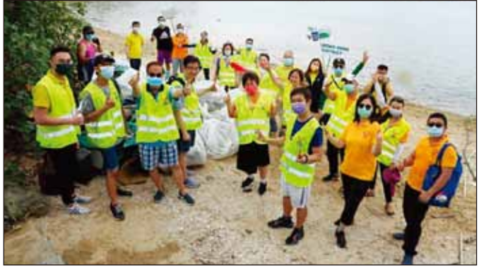
亞太洲域—香港：香港地區於4月25日在大埔三門仔清理海岸並乘坐龍舟。該活動是與運頭塘和JAMDB龍舟俱樂部合作，並與包括OISCA International（香港）在內的一些環保組織合辦。約60名聯青社友和龍舟運動員參加了此次活動，共收集了1428公斤的垃圾，包括漁網、家具等。