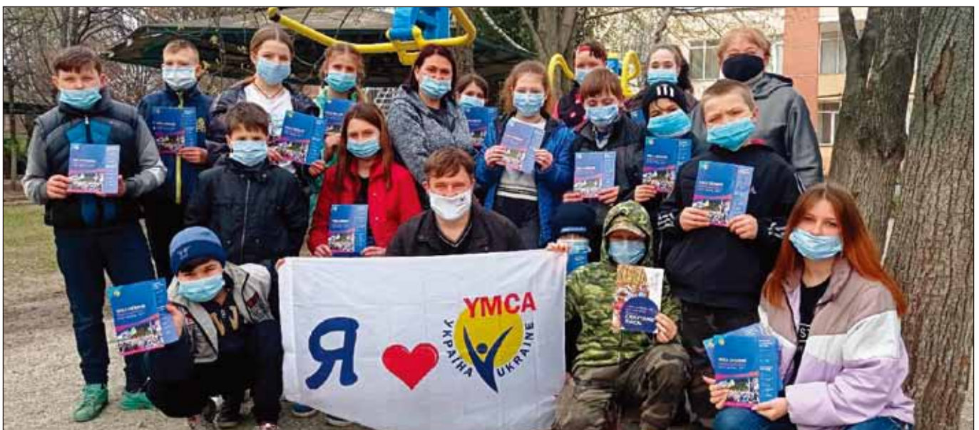
來自區域中心的一些小孩