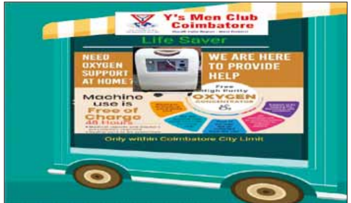
南印度區域Coimbatore社的公告

通過基金媒合系統，該洲域鼓勵並支持地區評估當地的需求並擴大以PPE 套件、N95 口罩、床單、枕套和其他必需品對醫院和前線醫療中心提供必要支持。