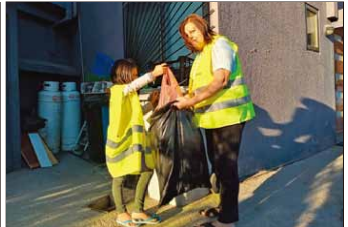
拉丁美洲—智利：聖地亞哥聯青社藉由強調和推廣5R，即回收(Recycle)、減少(Reduce)、重新利用(Repurpose)、恢復(Recover)，和重新思考(Rethink)來進行Week4Waste。我們相信回收是清潔環境所必需的。