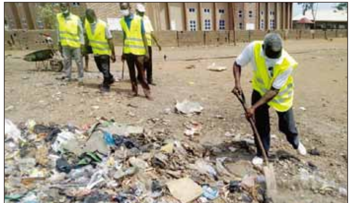
非洲—奈及利亞：作為 Week4Waste 項目的一部分，Kaduna聯青社以清理鄰近社區來慶祝他們的區域會長生日。