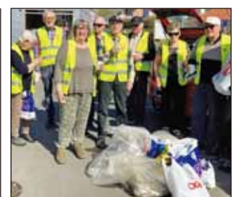
歐洲—丹麥：Marselisborg、Aarhus、Kronjylland、Soro-Dianalund、Lundenas 和Kolding聯青社，為一個更清潔的城市盡力。