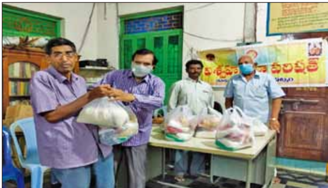
中印度區域的社提供食品雜貨給飢餓的失業者