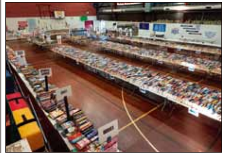
海量書籍等待顧客

桌子佈置不同，主要是以兩排桌子端對端，代替單排桌子端對端，這使得從一側到另一側的顧客之間的距離增加了一倍，超過 1.5m。令人驚訝的是顧客的反應很積極，尤其是臉書上的評論。他們喜歡人群有限制的事實，讓人們有更多的“空間”。