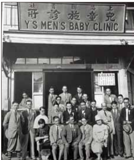
上海聯青社兒童診所，1928

1924年，來自 Nuuanu YMCA 的一名年輕的 YMCA 專業人員，在夏威夷被派往上海基督教青年會擔任“國外幹事”。由於他會說中文和英文，他還有一個額外的優勢，那就是能夠與會員和工