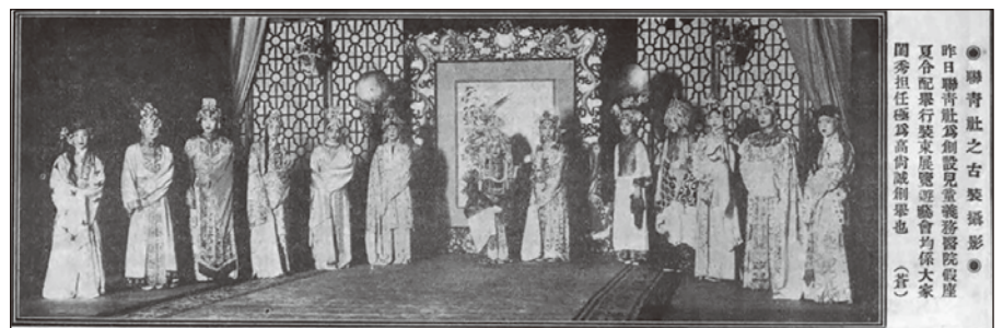
1926年上海聯青社募款時裝秀