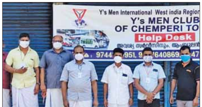
西印度區域 Chemperi 聯青社為那些希望得到救護車和藥品的服務而開設了一個服務台。

由印度的社所啟動的社區健康是要服務並照顧最近在這國激增的 COVID-19 患者、支持負擔沉重的