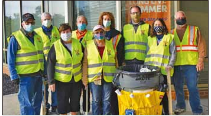
美國：在聖路易的Carondelet 基督教青年會服務社（聯青社）的社友幫助清潔基督教青年會的周圍環境，作為 Week4Waste 活動的一部分。