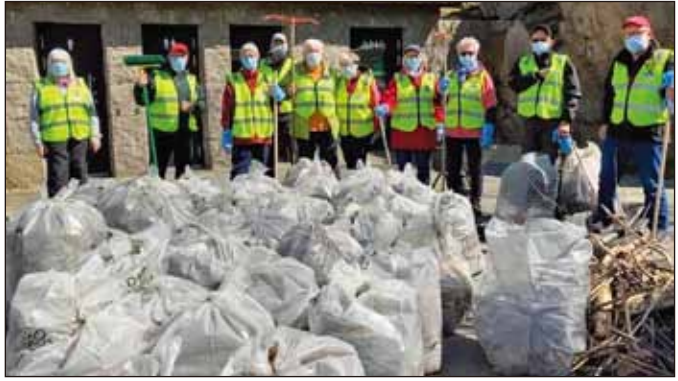
歐洲—挪威：Mandal 聯青社在 Ulsvika 公園收集了 750 公斤有機海藻和 20 公斤塑料作為 Week4Waste 活動的一部分。