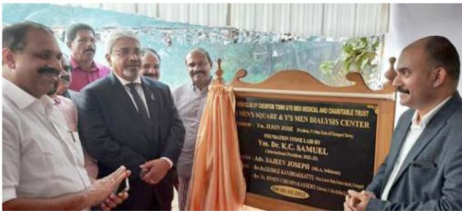
Chemperi Town 聯青社為聯青廣場& 洗腎中心舉行奠基儀式