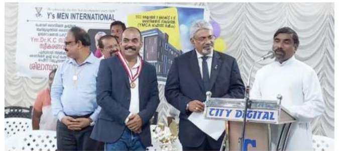
在 Chemperi 奠基後的會議。在背景中可以看到擬建的建築物圖