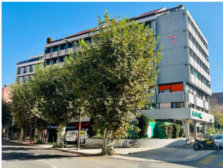
日內瓦 YWCA 大樓 - 國際聯青社國際總部 (IHQ) 所在地，瑞士日內瓦。

最後，我們提醒您開展 100 天募集社友活動(100 Days Membership Campaign) 。雖然我們希望得到更廣泛的回應，但我們感謝參與我們調查的人。該活動將持續到 12 月 9 日。請盡最大努力招募新的社友並考慮贊助成立新社。我們期待著在下個月慶祝您的成功。