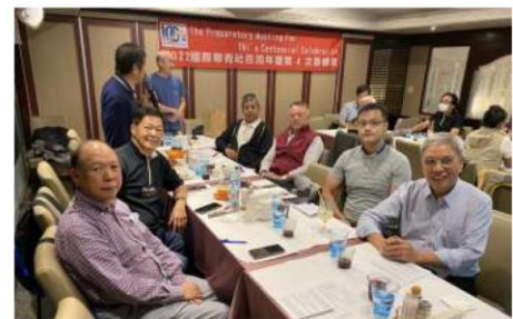
籌辦 100 週年慶典