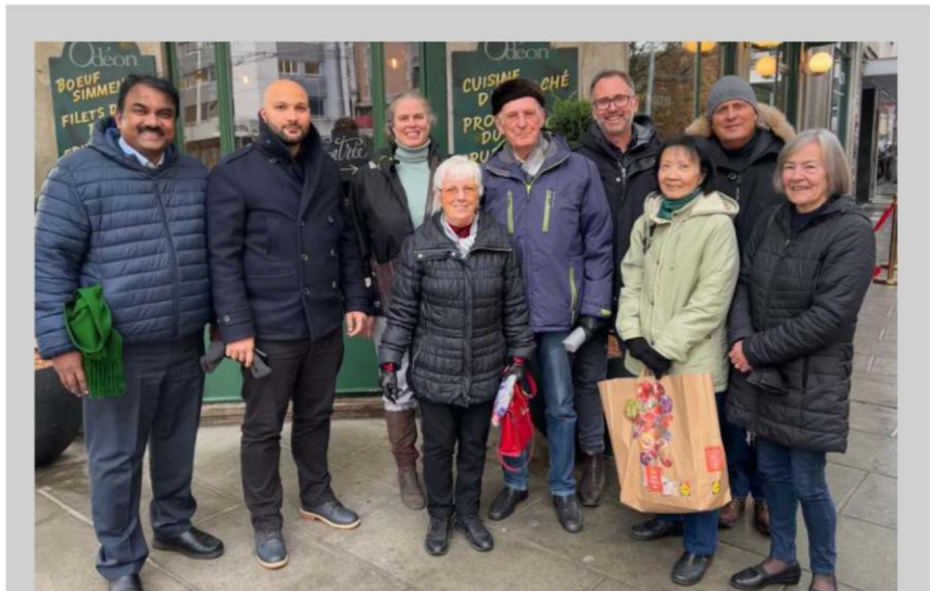
員工和前員工聖誕聯歡午餐

百週年可能已經過去，但慶祝活動仍在繼續！國際聯青社百年慶典，即 YMI 100，即將來臨，主辦委員會正在對節目進行最後的潤色，然後準備於 3 月 10 日至 12 日在台灣台北歡迎您。自由選擇的擊退瘧疾 RBM 高爾夫錦標賽將於 3 月 9 日舉行。如果您還沒有註冊，請不要再等了！請上 www.ymi-100.org 並預訂您在歷史上的位置。