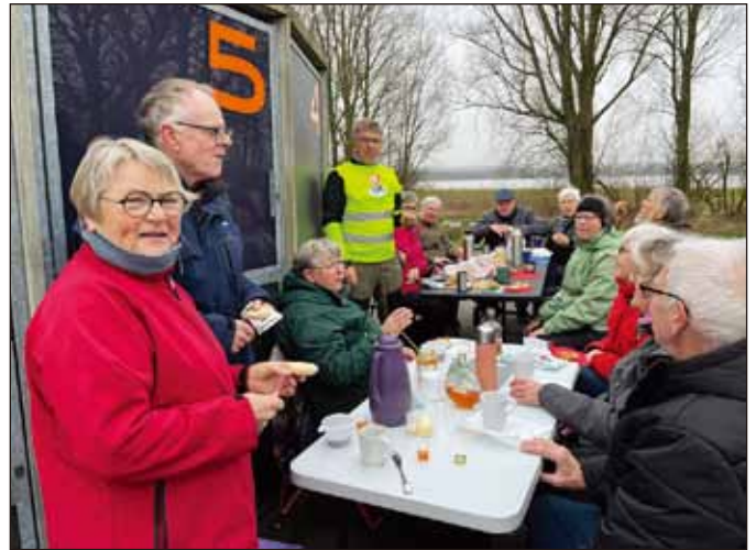
Aarhus Nordstjernen 聯青社社友和同伴參加了 Week4Waste，在 Egå Engsø 附近的一個地區收集垃圾。清理工作完成後，他們享用了自製的麵包和其他好吃的東西以及一些可以熱身的東西。