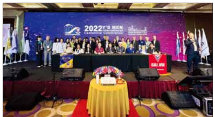
在臺北的YMI 100上締結兩個新的IBC(國際兄弟社)關係。一是台北城中社(臺灣)與RAHA菲律賓建立IBC關係，另一是 大阪(日本)和中區托萊多(美國)締結。