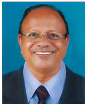
V.S. RADHAKRISHNAN 先生 （印度·中Travancore區域） 國際理事會理事當選人 2023 年 7 月 1 日至 2024 年 6 月 30 日； 國際理事會理事 2024 年 7 月 1 日至 2026 年 6 月 30 日