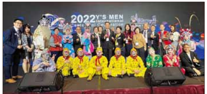
The entertainers 表演者們