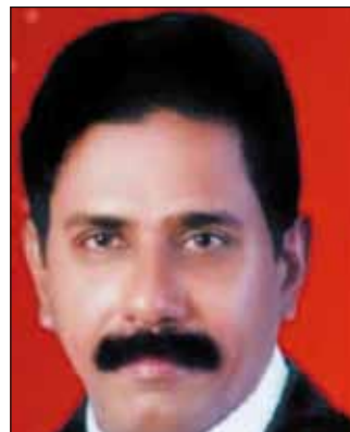
Pilson LOUIS 先生（印度·西印 度區域） 國際理事會理事當選人 2023 年 7 月 1 日至 2024 年 6 月 30 日； 國際理事會理事 2024 年 7 月 1 日至 2026 年 6 月 30 日