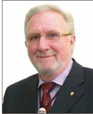
Erik BREUM 先生（丹麥·丹麥區域） 國際財務長當選人 2023 年 7 月 1 日 至 2024 年 6 月 30 日 國際財務長 2024 年 7 月 1 日至 2027 年 6 月 30 日