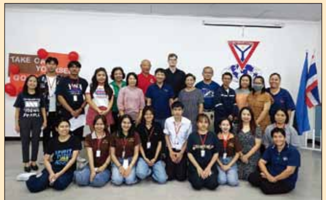
與清邁YMCA的朋友和工作人員