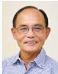
余 長 國際聯青基金EF督導 社別：長春社