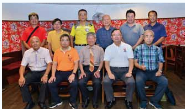
亞太洲域大會籌備會