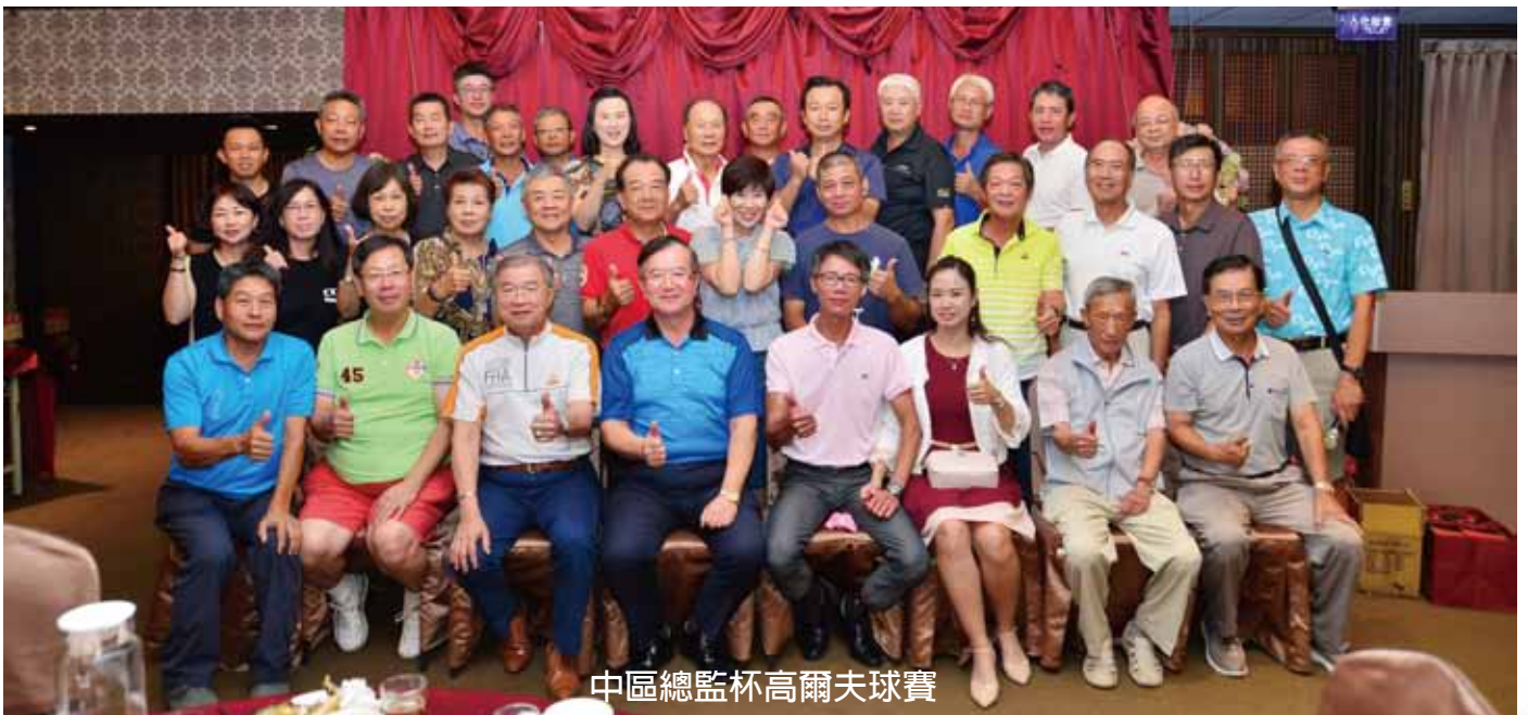
中區總監杯高爾夫球賽