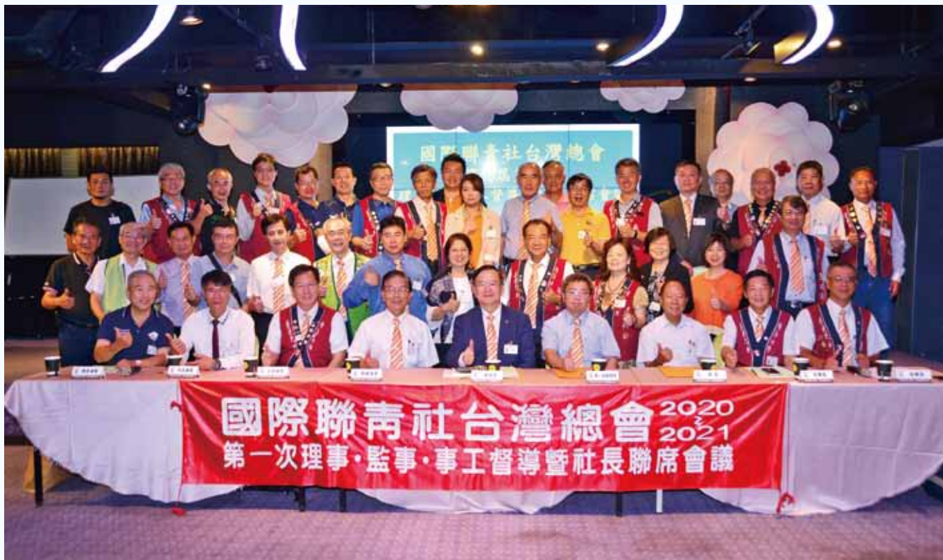
第一次理事、監事、事工督導暨社長聯席會議