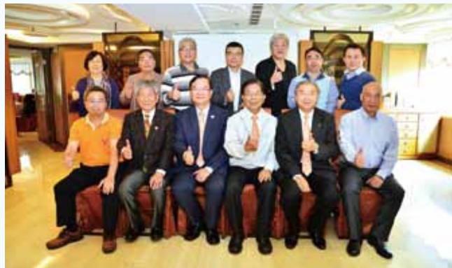
元月份常務理監事會