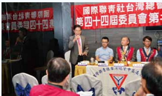
中區第二次委員會