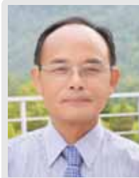
余長 聯青基金EF督導 社別：長春社