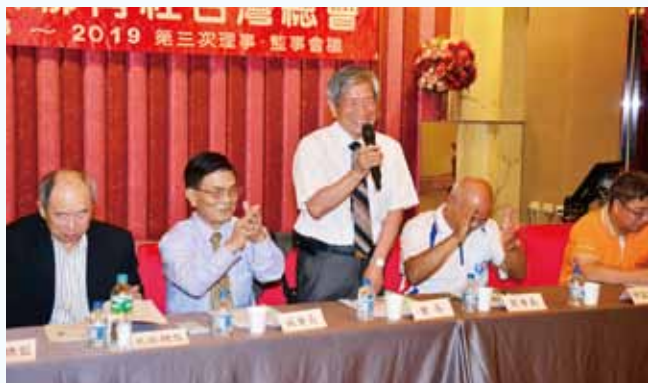
第三次理監事會議