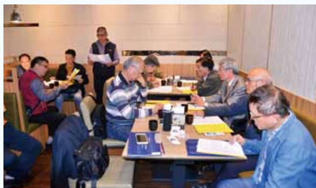
第二次常務理監會議