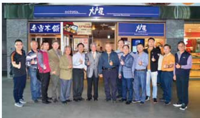
第二次常務理監會議