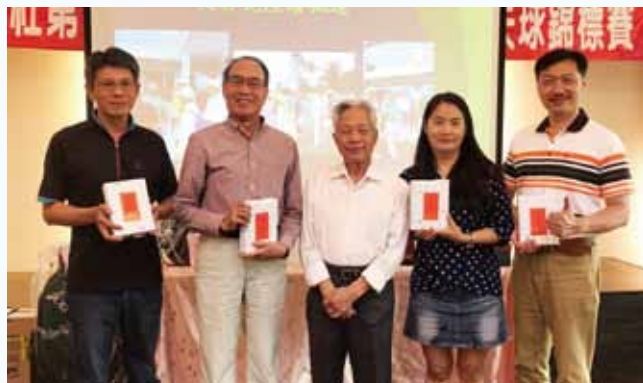
43屆會長杯高爾夫球賽