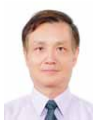
李啟銓 (聯合社) 國際聯青訊息翻譯督導