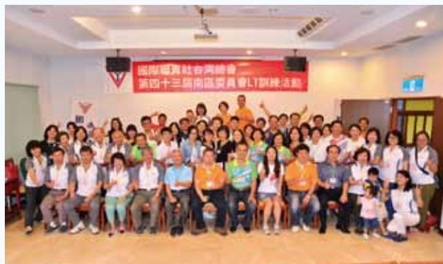
南區委員會第43屆LT活動