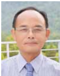
余長 (長春社) 聯青基金EF督導 / 理事