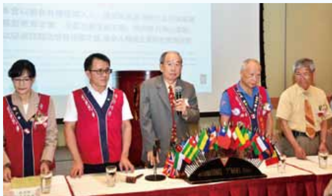
北區第一次聯合例會