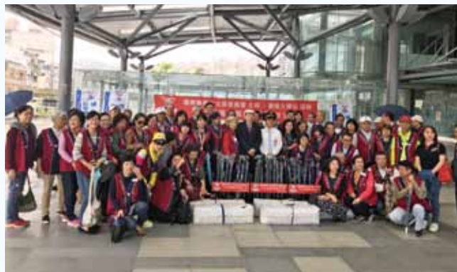
北區愛心傘捐贈活動