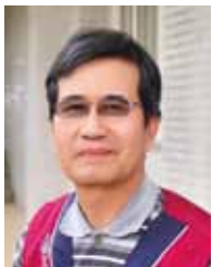
黃信明 (中央社) 社長