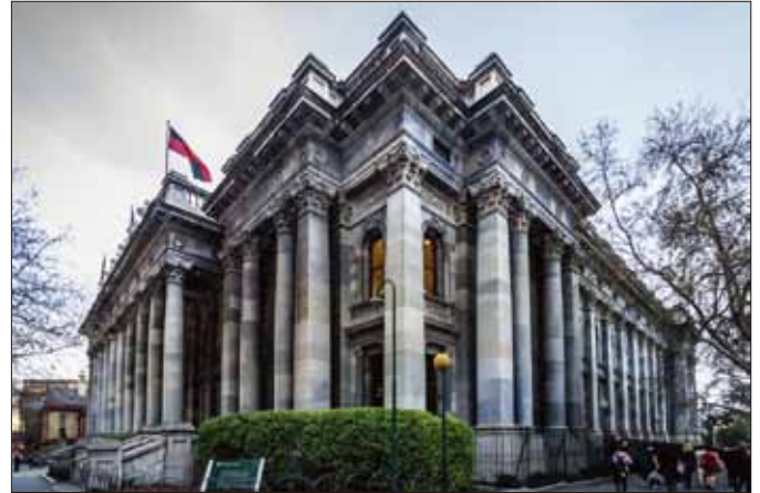
舉行會議的南澳大利亞議會大廈

期四的早上，我的隊員決定在法院的下院完成一個惡作劇，我們用“折扣ABBA”的歌曲唱出我們自己的敘情詩，那是非常熱鬧的一場。