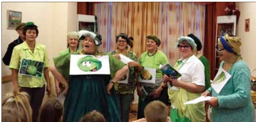
俄羅斯的「高麗菜女士」

菜（一種傳統的俄羅斯蔬菜）做菜、還有煎餅、排骨、餡餅和湯。她們唱「高麗菜」歌，讓自己和所有人開心。該活動由Khibini-Tietta聯青社舉辦。他