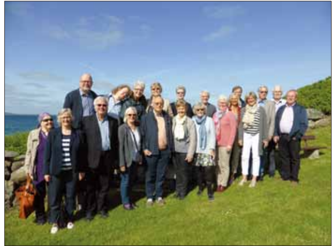
一些成員出去郊遊

社團會議舉辦在一間老舊被改造而成的穀倉裡，平均有70位社友會定期參加。會議遵循傳統聯青社的議程，包括有趣的談話、涵蓋各種主題、晚餐、唱歌和祈禱。當新成員加入時，就舉辦不比傳統的新社友宣誓正式的儀式。該社團嘗試尋找用非正式的方法去完成聯青社的例行公事。最主要的宗旨是看見每位參加社團活動的人感到愉快且想回來加入社團。該社團歡迎所有人，但必須為一位基督教徒。該社團是怎麼成立的呢？一對退休的聯青夫婦，在斯塔萬格居住35年後回到曼達爾，與他們的一些朋友討論著組成一個聯青社，在50年前他們全部都是曼達爾YMCA青年社的成員。他們邀請15位朋友