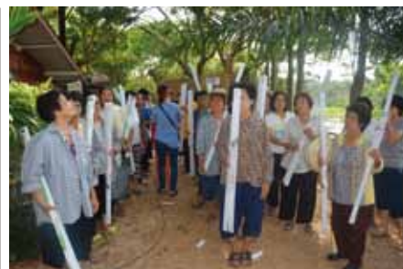
快樂的村民與他們的LED燈

在南邦府(Lampang Province)的Na Kwao Kiew村，為45個家庭提供了90個LED燈，以取代T8熒光燈。村民們也確保在不使用時關燈並拔掉電源以節省電力。他