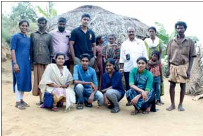
聯青社社友和部落小村莊的一些居民

第一項活動是和喀拉拉邦北部地區科澤科德的兩個部落小村莊的居民慶祝聖誕節。小村莊嚴酷的事實讓所有人大開眼界。他們花了一整天和他們一起唱歌跳舞，共享聖誕節蛋糕，並提供他們一些需要的日用品。能夠在這佳節期間傳播歡樂和鼓舞，所得的回報是一種高度的滿足感。