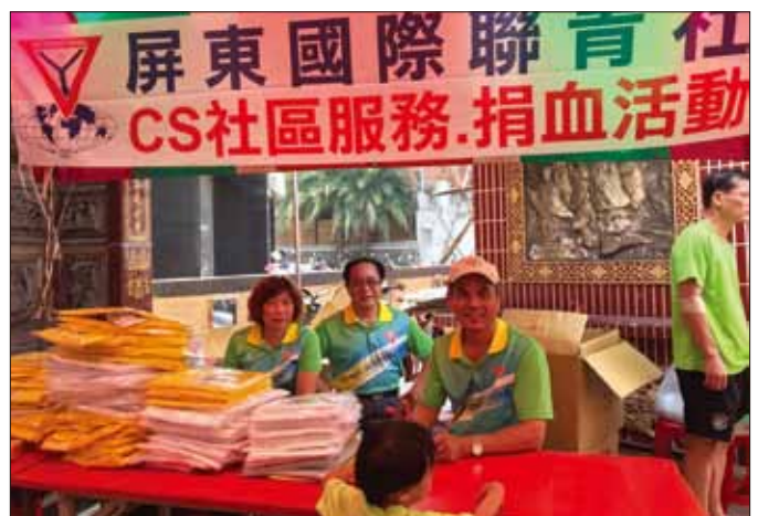
社友們等待民衆前來捐血

屏東、台中大業聯青社和台灣中區都分別舉辦了捐血活動，作爲社區服務事工的一部分。聯青家庭不僅率先捐血，同時也以贈送T卹，米和茶鼓勵當地民眾捐血。每次活動，每社或區約可募集到