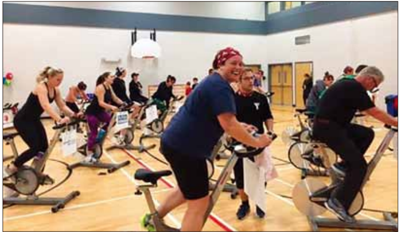
快樂騎車以幫助兒童

YMCA於10月舉辦的第一屆「慈善騎乘(Spin-a-Thon)」活動，非常成功，為Strong Kids（強健兒童）事工籌集了超過10,000加幣。來自New Brunswick首府城市的20家企業贊助商，150名自行車手和25名志願者聯手打造了「Spin-a-Thon」，使它成為聯青社2018最大的募款活動之一。Fredericton的Epsilon 聯青社也是支持「強健兒童」事工的合作夥伴之一。