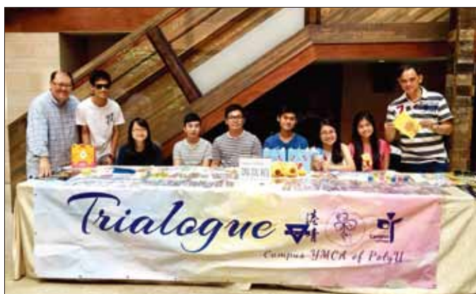
左圖：5月份的籌款活動，以及在泰國北部村莊，大學生與孩子們玩在一起

今年五月的一個下午，來自香港理工大學校園YMCA的一群學生在香港港青YMCA舉行籌款活動，以支持他們於六月初前往泰國北部的服務。