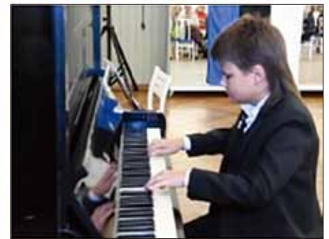
來自四個國家的音樂家在慈善音樂會上的演出