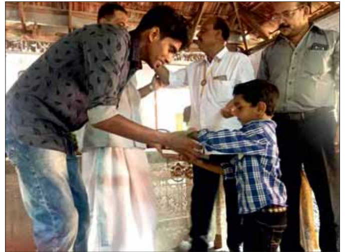
這小男孩得到了生命要素— 閱讀和寫作的機會！

Gokarna，它是以寺廟和沙地海灘而聞名，這自然和文化探險之旅被證明是一個助推器。跋涉經過自然環境和參觀市內眾多的朝聖地點是一次不一樣而又令人興奮的體驗。他們還抽出時間清理主要的Gokarna海灘並與當地人交談，以了解更多有關當地