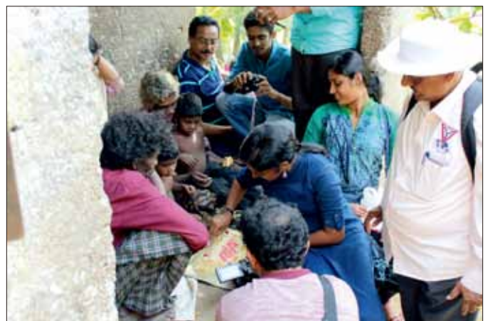
與一些村民共度美好時光