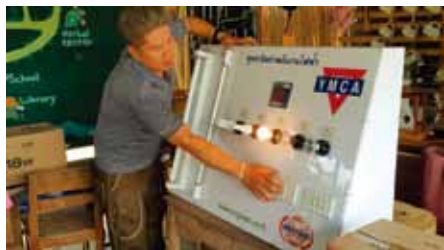
工作坊上節省電力的演示

全球暖化氣候變遷是需要社會各階層採取行動的嚴肅問題。泰國清邁的Sao Hin YMCA定期展開有關環境和氣候變化的教育計劃。在國際聯青（Y's Men International），特別是國際聯青綠色團隊主席Colin Lambie的支持