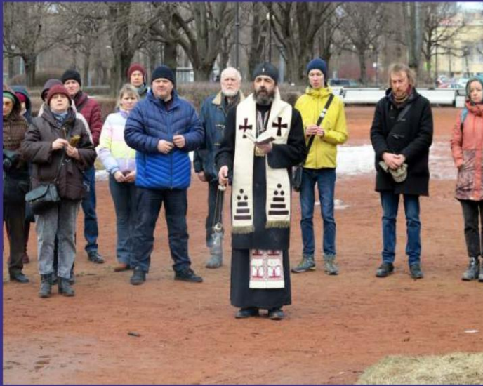
由獨立教會的牧師為雙方受害者舉行的禮拜。 “官方”教會的教長支持“特別行動”。