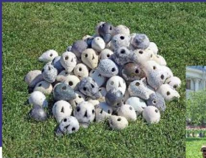
我們的藝術家在露天展覽 中抗議戰爭。