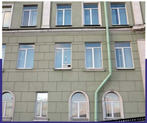
我們的當局選擇字母“Z” 作為“特別行動”的標記。

我們所有人都生活在這場戰爭的壓力下——有些人讚成，有些人討厭它。這看起來像是一場冷內戰——邊界線經常將一個家庭的成員分開。如果你想找一個志同道合的人，你應該知道一個密