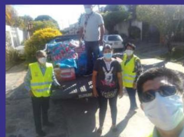
拉丁美洲合作夥伴區域 會長和友好單位的捐贈