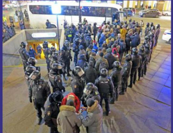
在聖彼得堡中央大街 抗議的人被捕