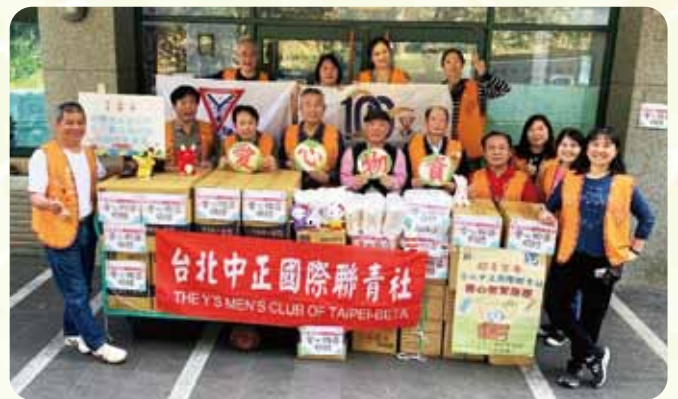
中正社CS教養院關懷活動