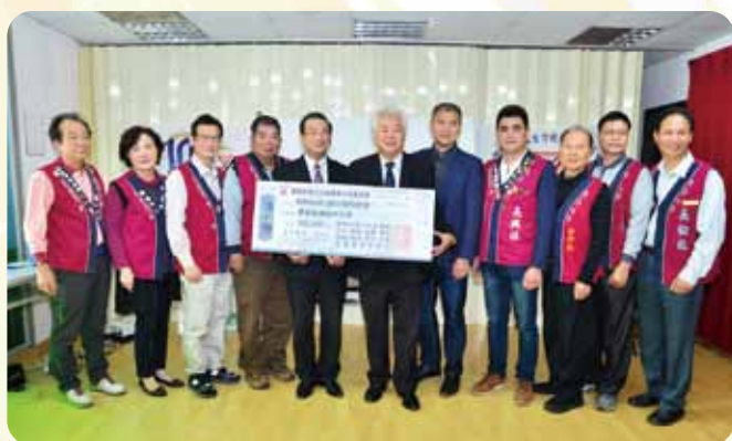
贊助南投YMCA老人送餐服務工作