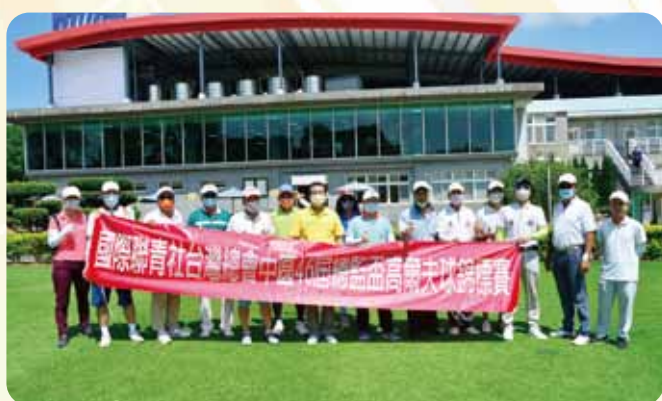
中區總監盃高爾夫球賽