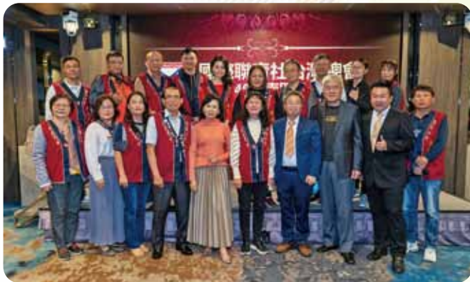
南區聯合例會～港都社