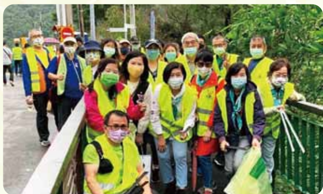
北區情聯茶園淨山