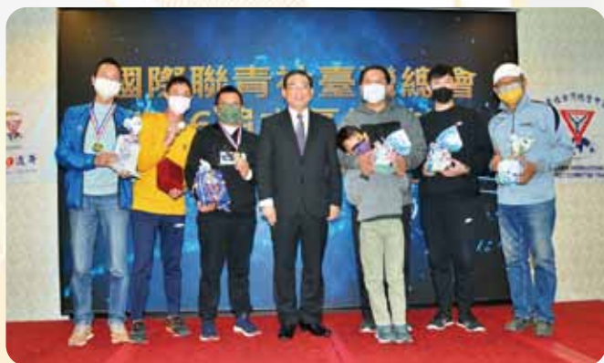
中區總監盃保齡球賽