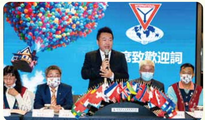
第一次南區聯合例會