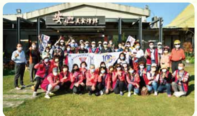
中區單車樂活輕騎活動