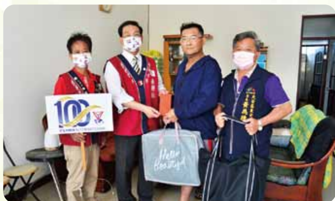
訪視獨居老人致贈慰問金