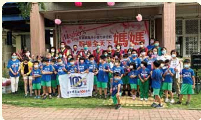
屏東萬丹社好禮運動頒獎