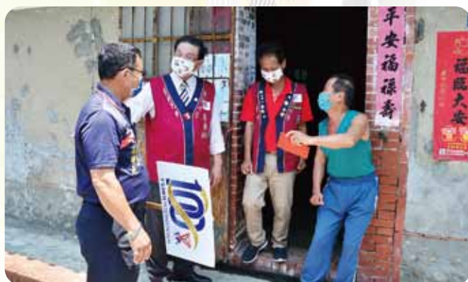
訪視獨居老人致贈慰問金