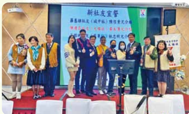
北區第一次聯合例會新社友宣誓