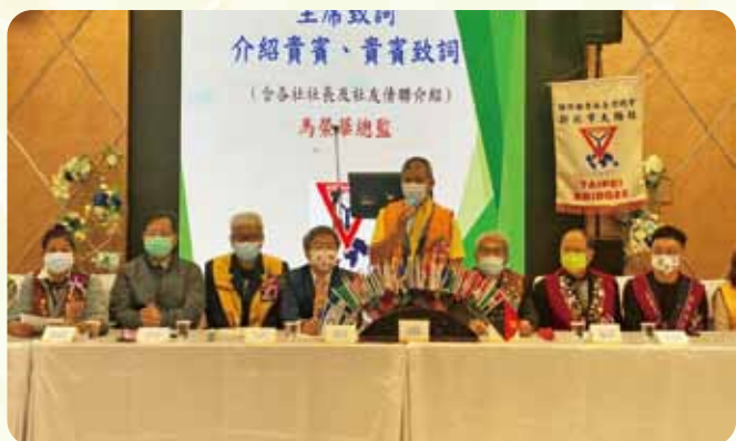
北區第一次聯合例會