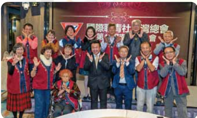
南區聯合例會～屏東社