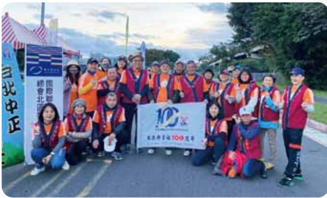
北區EMC活動台北馬拉松補給站志工