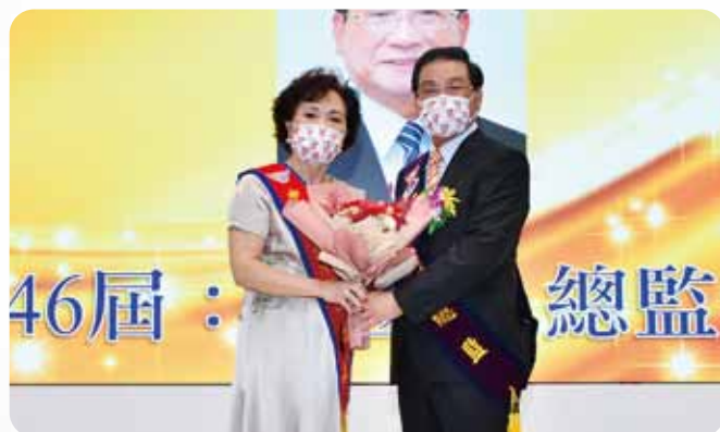
中區總監交接於臻悅美饌婚宴會館