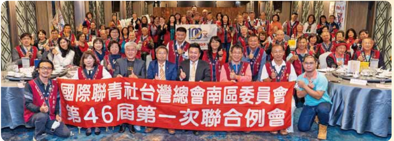
第一次南區聯合例會