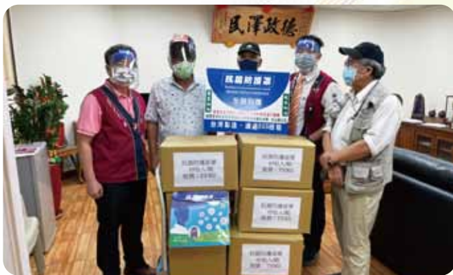
枋山訪察防護面罩捐贈