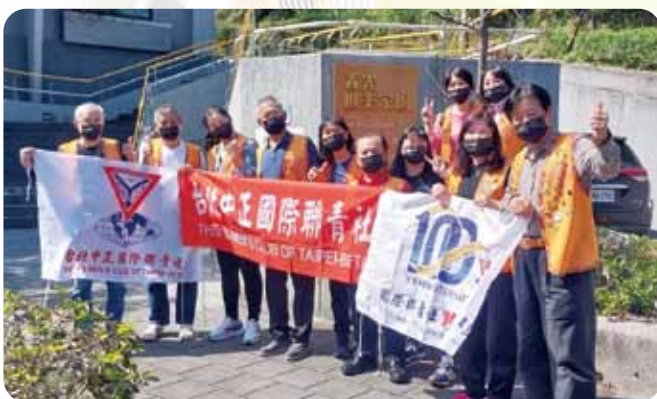
中正社CS教養院關懷活動