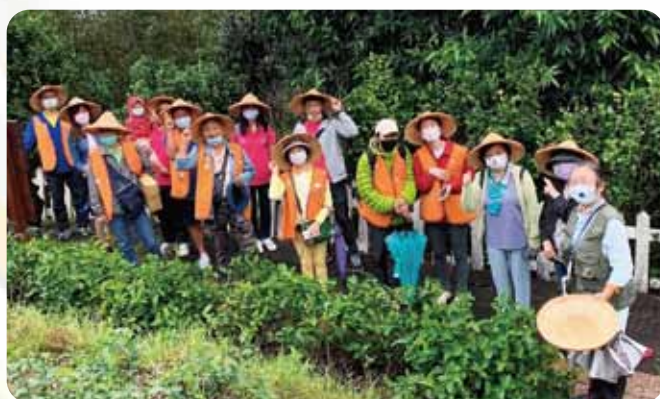
北區情聯茶園淨山