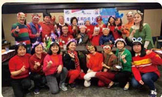
中正社聖誕聯歡晚會