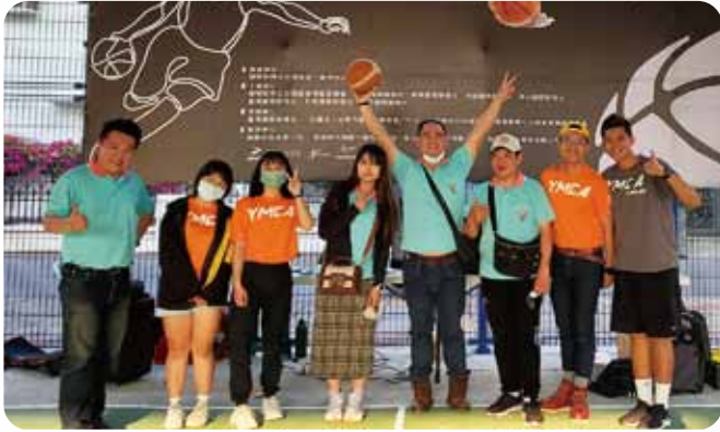
南區CS活動五對五籃球邀請賽