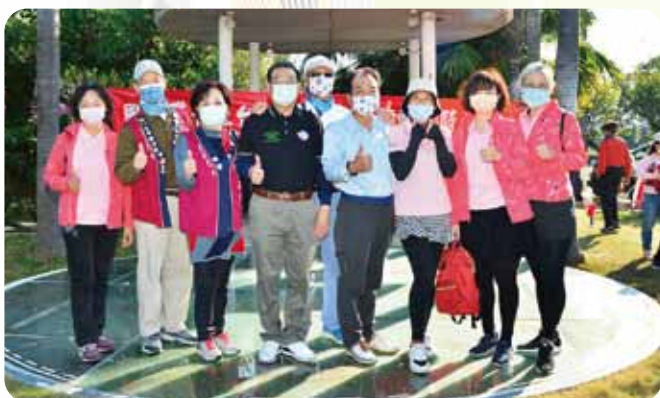
中區單車樂活輕騎活動