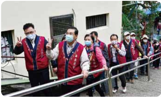
中區僑聯旅遊活動