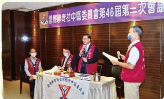
中區第二次委員會