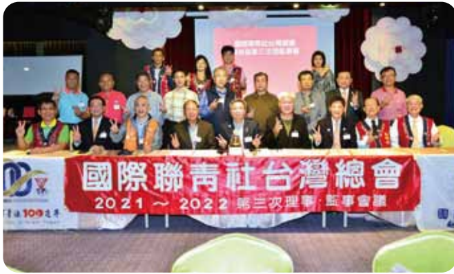
三月份全國理監會