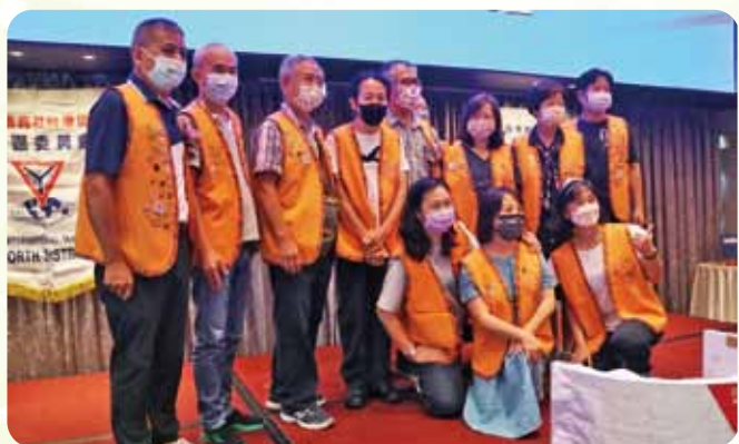
北區第一次聯合例會