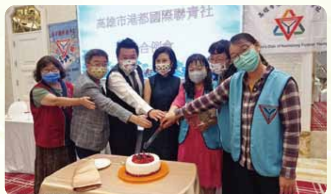
港都社&永青社聯合例會