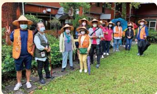
北區情聯茶園淨山