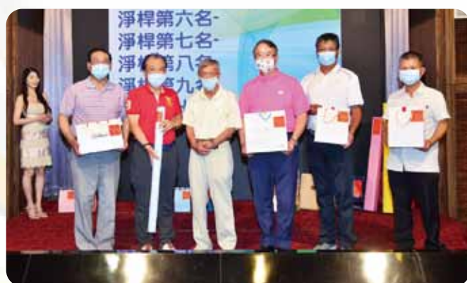
中區總監盃高爾夫球賽