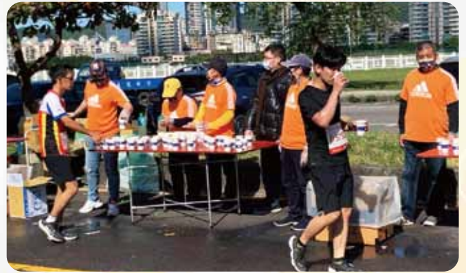
北區EMC活動台北馬拉松補給站志工