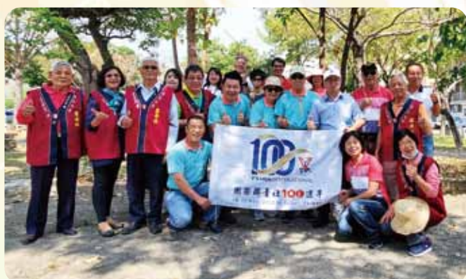
南區CS活動五對五籃球邀請賽