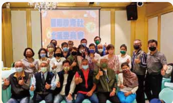
北區委員會第二次會議