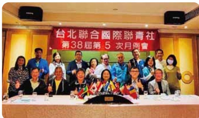
台北聯合社月例會