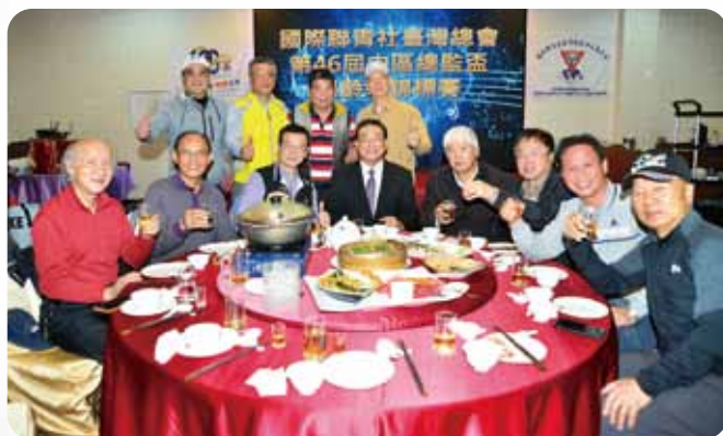
中區總監盃保齡球賽