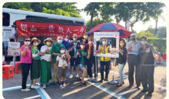
台北聯合社捐血活動