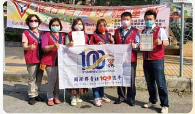
永青社好禮運動頒獎