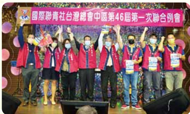
第一次聯合例會各社新社友宣誓