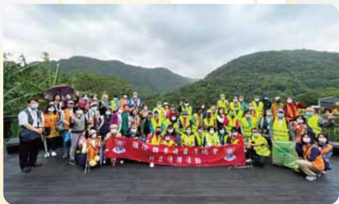
北區情聯茶園淨山