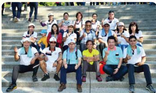
中區登山健行活動