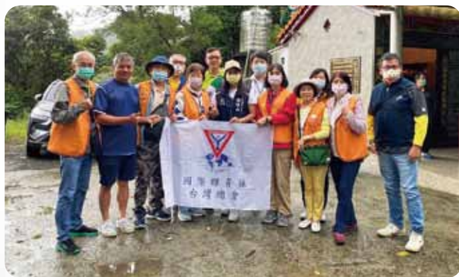
北區情聯茶園淨山