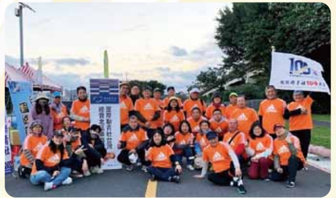
北區EMC活動台北馬拉松補給站志工