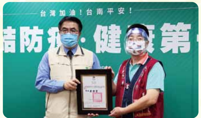
捐贈台南市政府防護面罩