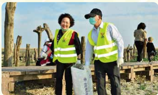
中區國際清潔周淨灘活動