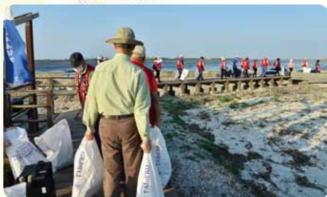
中區國際清潔周淨灘活動