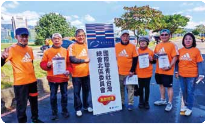
北區EMC活動台北馬拉松補給站志工