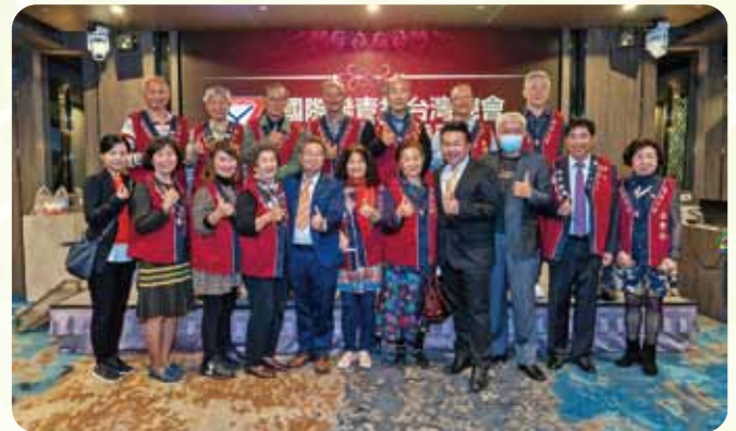
：南區聯合例會～高雄社