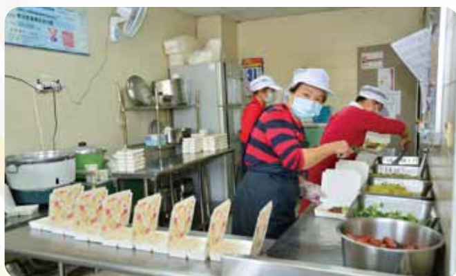
贊助南投YMCA老人送餐服務工作