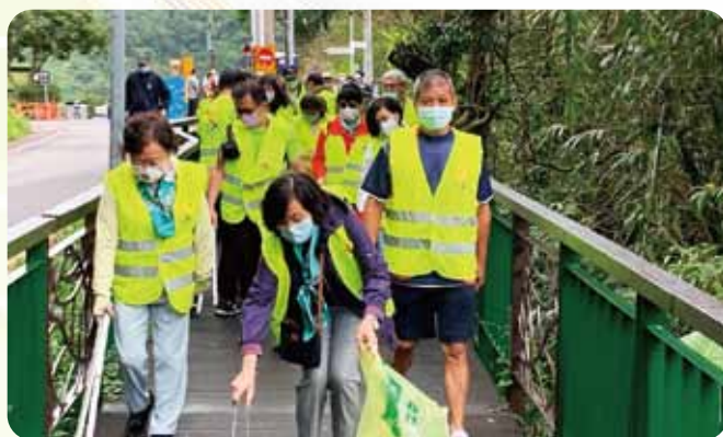
北區情聯茶園淨山