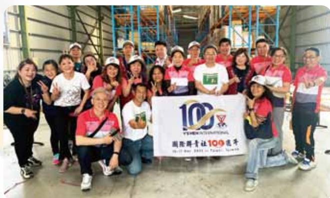
高雄社&永青社食物銀行