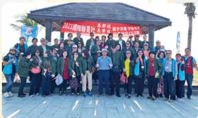
大橋長榮港都三社聯合例會