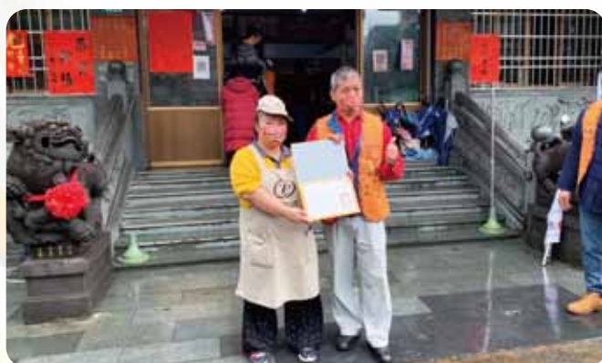
北區CS捐發票喜憨兒烘焙坊