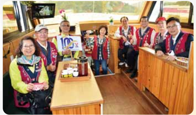
中區僑聯旅遊活動