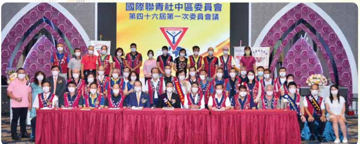
中區總監交接於臻悅美饌婚宴會館