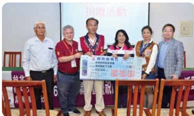
城中大業屏東三社聯合例會