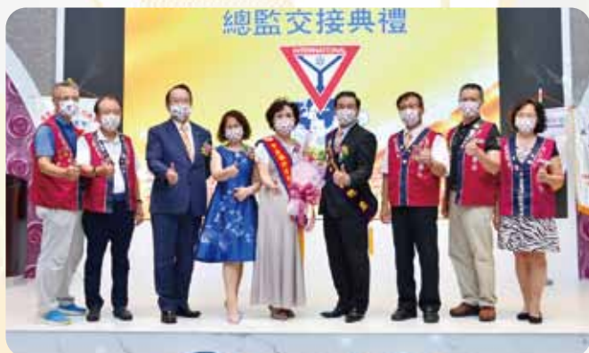
中區總監交接於臻悅美饌婚宴會館