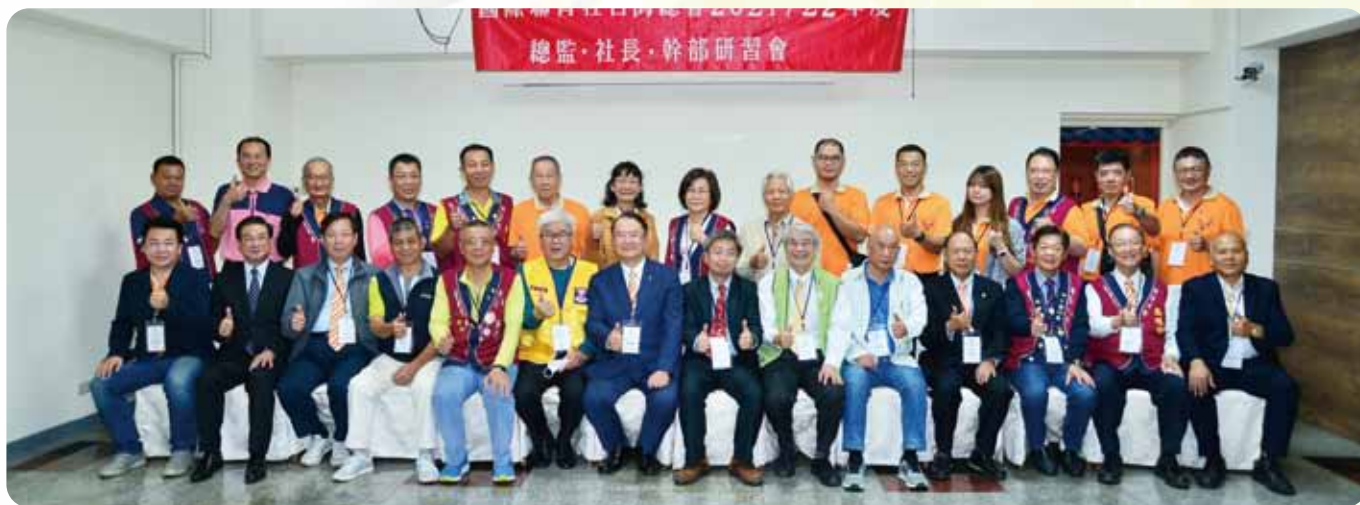
總監、社長幹部研習會