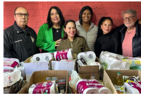
致贈物資由Ri!^AY qĩãã • 學校代表接受