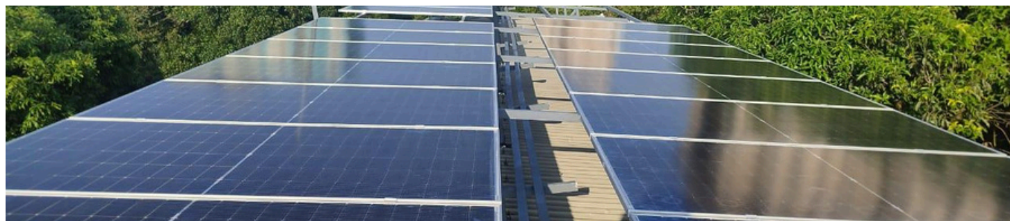
印度Kerala邦Aluva基督教青年會營地中心的太陽能板