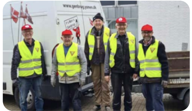
參與丹麥家庭用品的回收和再利用