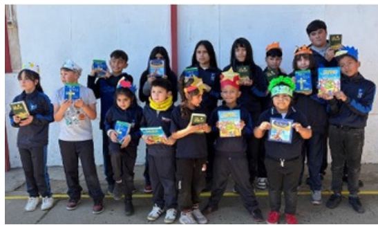
分發聖經—給Ri!^AY qĩãã • 學校的學生