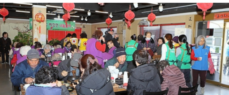
Jeonju Poong Nyeon & Jeonju Haengbok Club