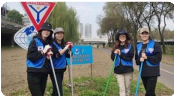
在韓國執行緊急災害救援和環境改善項目