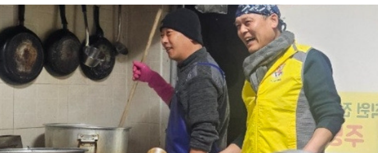
Jeonju Solnae Club