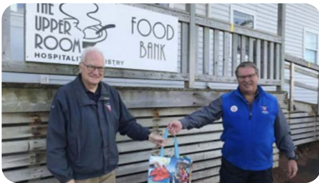
在加拿大捐款給食物銀行