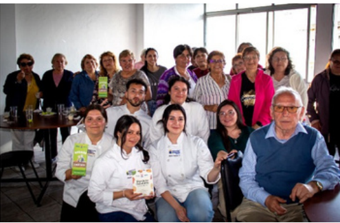
老年人的幸福養生計劃— 重點關注心理健康和健康飲食

該社至今仍然活躍，並堅定致力於其工作，尤其是在培養青年領袖方面，並與Valparaíso基督教青年會密切合作，共同開展社區活動並支持Jorge Williams學校。