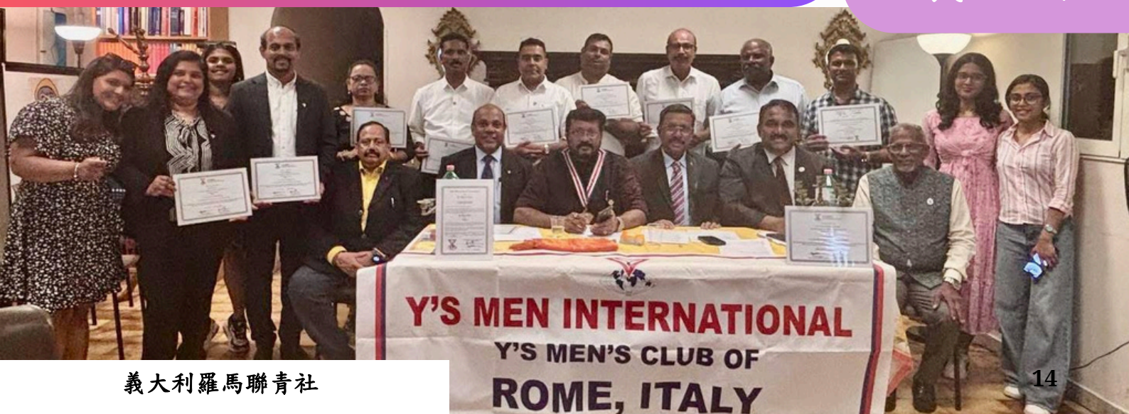
義大利羅馬聯青社