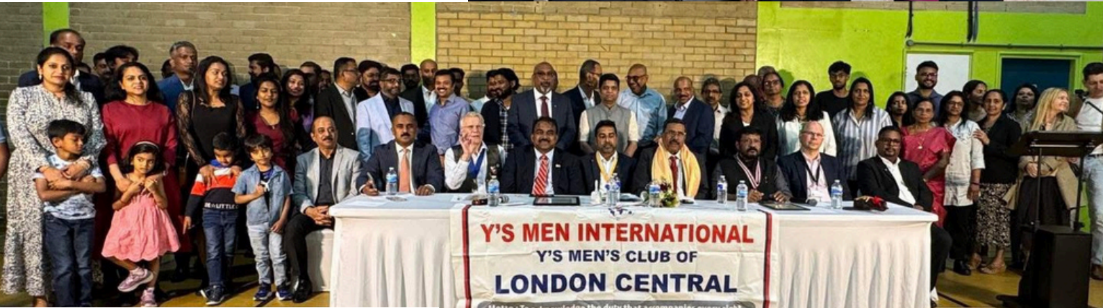
London Central 聯青社