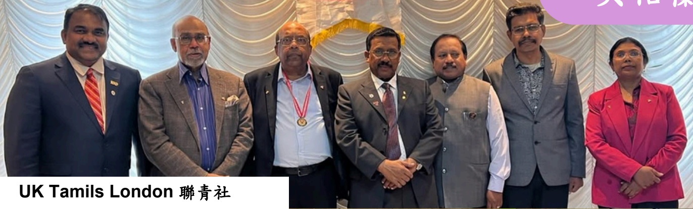
UK Tamils London 聯青社