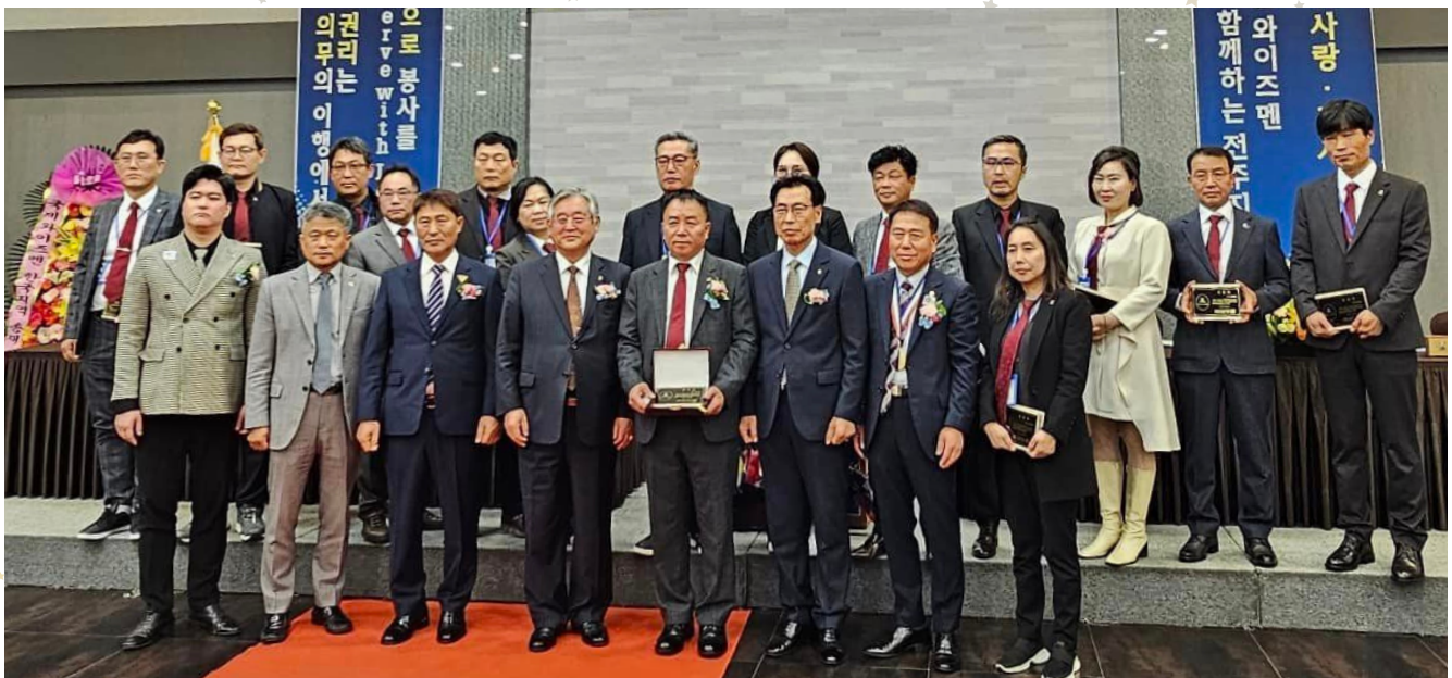
韓國洲域，Chonbuk 區域，Jeonju Mugunghwa 聯青男女社舉行授證成立儀式