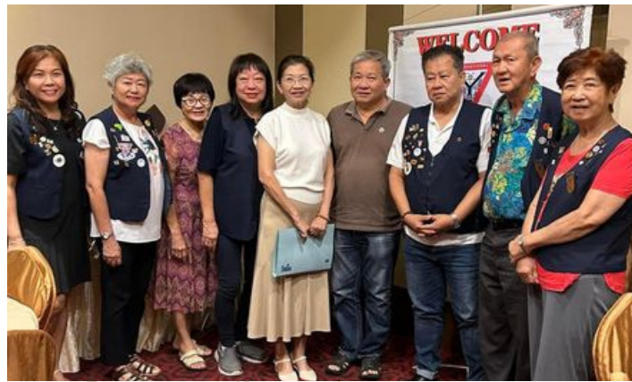
銀州聯青服務社歡迎一位新社友