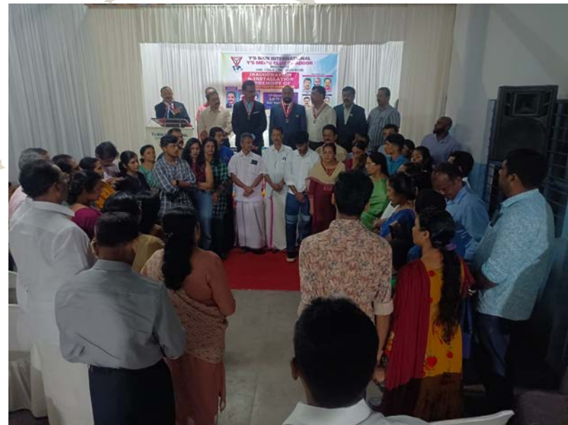
印度洲域，中Travancore 區域， Kadampanad 聯青社授證成立