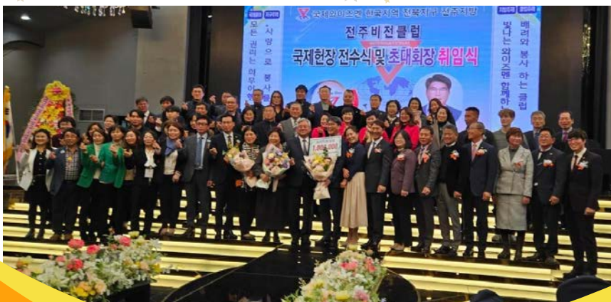
韓國洲域，Chonbuk 區域， Jeonju Vision 聯青社 授證成立儀式