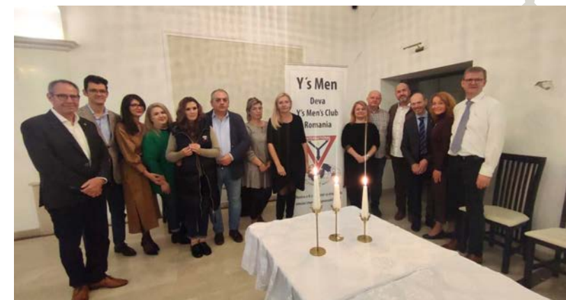
羅馬尼亞 Deva 聯青社授證成立 (丹麥區域-歐洲洲域)