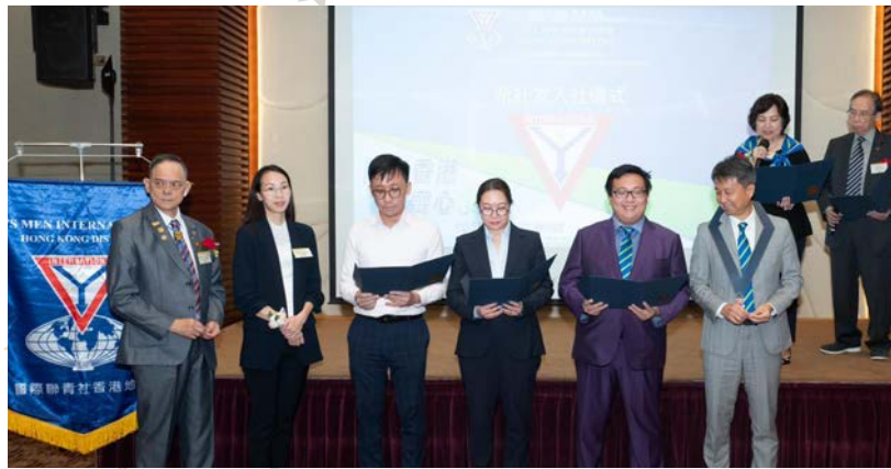
香港尖沙咀聯青社接納新社友們