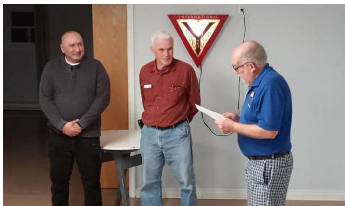
Sydney-Riverview 聯青服務社接納了兩名新社友 (Maritmes 區域- 加拿大暨加勒比海洲域)