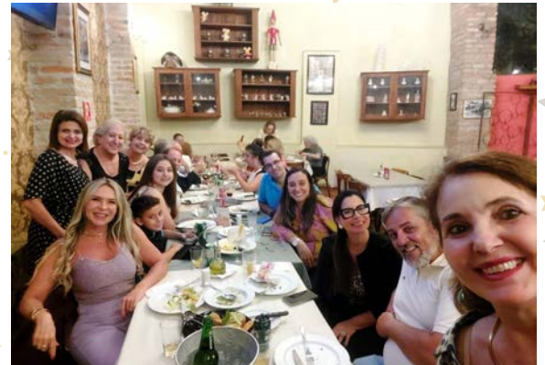
巴西的一些社齊聚一堂， 祝賀新社友和生日