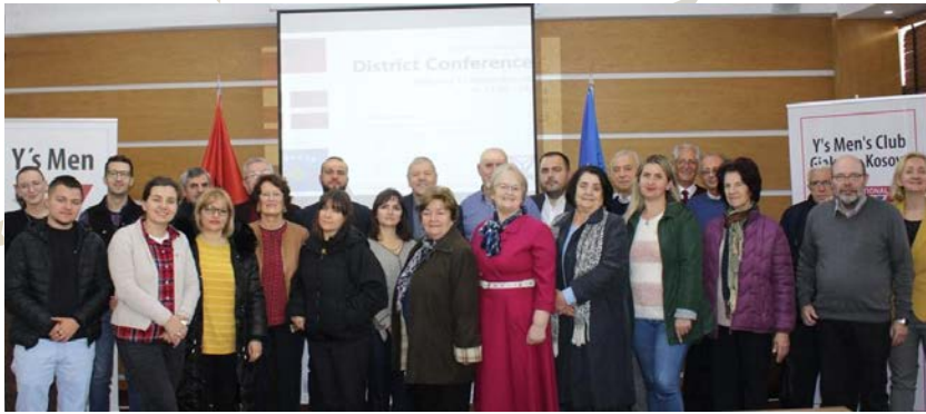
一個全新的地區 - 西巴爾幹 West Balkan 地區 (丹麥區域) 科索沃 Kosovo 主辦了第一次地區會議