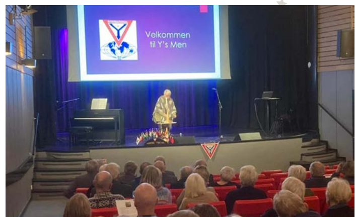
挪威 Mandal 聯青社 我們國際聯青大家庭中最大的社！