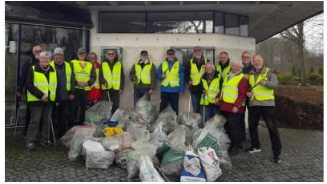
歐洲洲域 - Vejle 聯青社, 丹麥