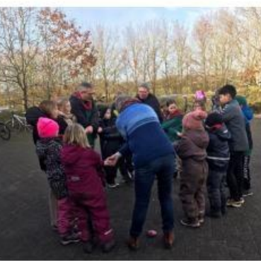
歐洲洲域 - Ringkøbing 聯青社, 丹麥