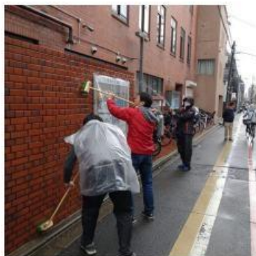
亞太洲域 - Kyoto Palace 聯青社, 日本