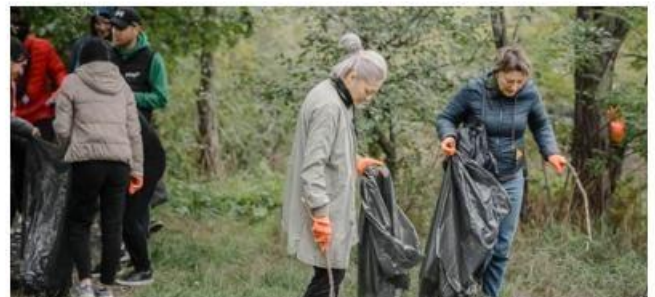
歐洲 - 摩爾多瓦 基督教青年會