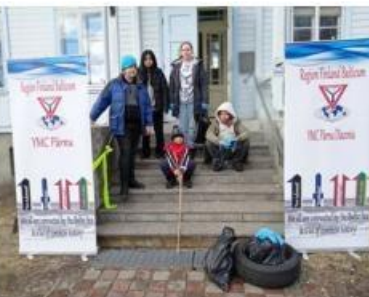
歐洲洲域 - Pärnu 聯青社, 愛沙尼亞