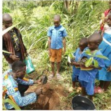
非洲洲域 - New Vision Bamenda 聯青社, 喀麥隆