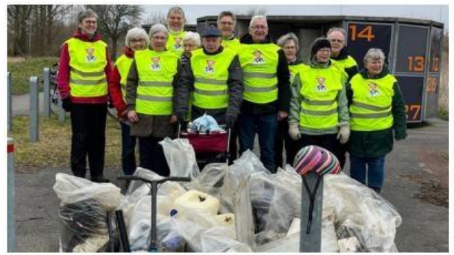
歐洲洲域 - Aarhus 聯青社, 丹麥