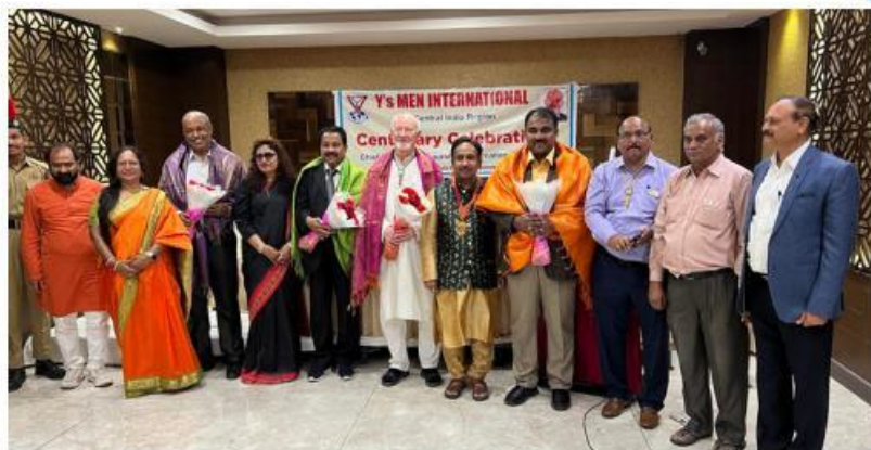
上：參加中印度區域在 Hyderabad 舉行百年慶祝會 左：拜訪在 Trivandrum 的印度洲域辦公室