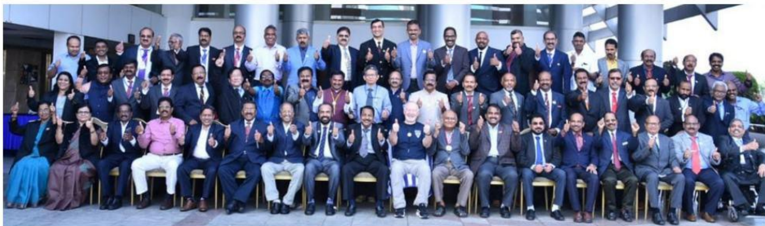
上：印度洲域區域會長當選人及地區總監當選人幹部訓練會