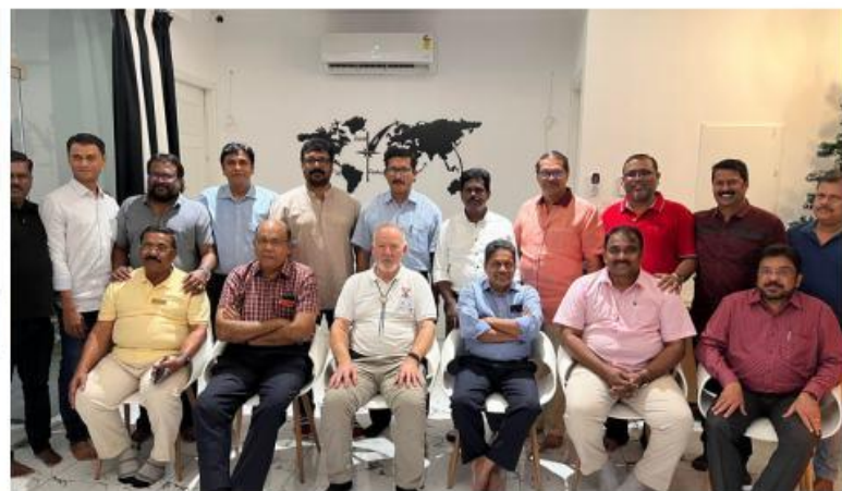
上左：日出，在 Kanyakumari 上：拜訪中西印度區域及 01 地區(MWIR)幹部們 左：參加在 New Delhi 舉行的北、東和東北區域 領導才能訓練會